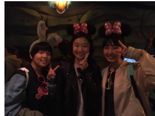
みんなの笑顔が はじけてるよ！