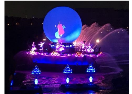
ディズニーは生徒たちにとっては ドリームランド・ワンダーランド。何 度来てもいいね。