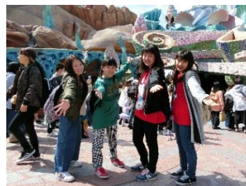
メキシコからの方と友達になりました。もちろん会話はすべて英語でした。メキシコ人は母国語はスペイン語なんですが、英語も話せるんです。