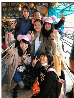
恐怖のタワーオブテラーの前で余裕？の一枚