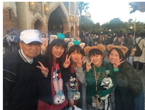
このグループはタワーオブテラーに4回も乗ったとか。すごいね。