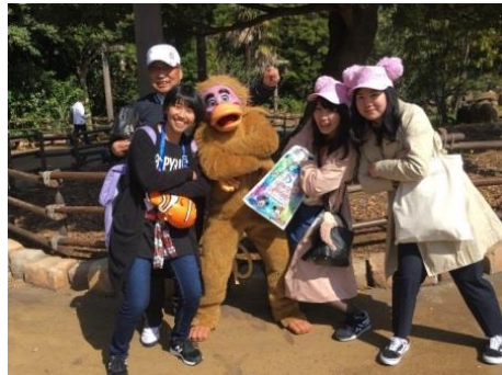
マントヒヒを思わせるこのキャラクター何んだっけ？