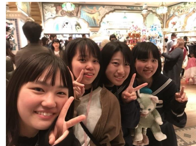
ディズニーに中学校の制服。これがトレンドとか。そういえばシーでたくさんの制服姿見かけたよ。