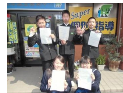
みんなで合格!! I MADE IT (やったぞ)