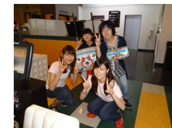
ボーリング大会、豪華な賞品に大喜び