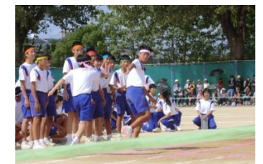
もう少しでバトンタッチ