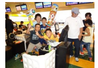
スペアとって、ピース